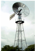
Windrad am Elf-Apostel-Weg

Wenn Sie die Route nicht abkürzen wollen, folgen Sie weiterhin der weißen Route. Sie werden zum "Surkse Backhüs" zurückgeführt.