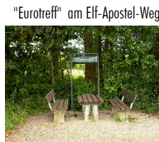
"Eurotreff" am Elf-Apostel-Weg