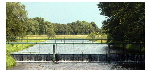
Stauwehr an der Aa

"Lange Fohre" zur "Dinxperloer Straße", rechts ab. Erste Straße links = "Keminkswede", geht über in "Vogelpoll". Erste Kreuzung links = "Im Jägeringshof". Nächste Straße links = "Wollstegge". Vor dem Transformator rechts über Hofzufahrt zum Haus Nr. 33 auf den Stichweg zur Bocholter Aa. Auf dem Deich rechts ab. An Kreuzung "Zur Demmingbrücke" weiter geradeaus über den Deich. Erster Stichweg rechts. Am geteerten Weg = "Tenbenschel" rechts. An der Kreuzung links = "Zur Demmingbrücke". Zweiter Weg rechts = "An der Koppel". Erster Weg links = "Das Horsie". An der Kreuzung "Dinxperloer Straße" geradeaus = "Zur Mühle". Am Ende rechts = "Hahnenpatt". Nächste Straße links = "Elf-Apostel-Weg". Erste Straße rechts = "Lange Fohre" bis zum "Surkse Backhüs".