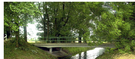
Brücke an Straße "Tenbenschel"

Folgen Sie der "Keupenstraat" weiter und biegen Sie links ab in den "Grenzweg". Sie kommen dann an den "Dorfplatz" in Suderwick mit Einkaufsmöglichkeiten, Eiscafé und Restaurant. Zum Ausgangspunkt "Surkse Backhüs" gehen Sie den Weg über "Grenzweg" und "Keupenstraat" zurück. Biegen Sie dann rechts ab in "Hahnenpatt". 2. Straße links = "Elf-Apostel-Weg". Die nächste Straße rechts = "Lange Fohre" bringt Sie zurück zum "Surkse Backhüs".